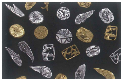
「アクセサリー・ブローチ」